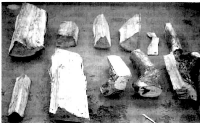
NÁSTROJ A OBĚŤ. Kusy dřeva, které Daniel Stupárek shazoval z mostu na automobily na dálnici.