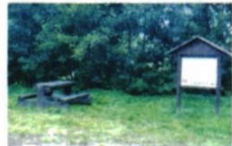
Odpočívadlo pro cyklisty v Polomí.

vit se můžete například v Bistru u Jarky nedaleko nádraží a pojedete dále směrem na Bělotin. Cestou je zbudováno opět jedno odpočívadlo pro cyklisty, mapa je ale bohužel poškozená.