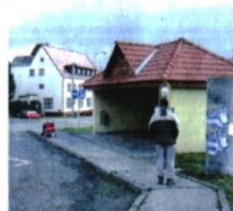
Zastávka v Bělotině.

Hladovější z vás mohou vyzkoušet bohatou nabídku místního motorestu, jiní mohou věnovat chvíli zajímavým informacím u autobusové zastávky. Dozvíte se například, že Bělotin je starý již přes 800 let. Reč je také o rozvodí, které se nachází u silnice mezi Bělotinem a Hranicemi. Právě zde, na Jelením kopci, se prý v době ledové postavilo putování skandinávského ledovce.