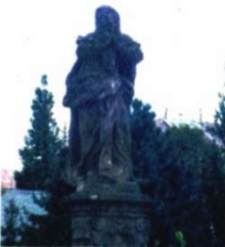
Socha panny Marie v Hranicích.

Hranicko/ Před námi je předposlední část našeho seriálu po stezkách pro cyklisty v okolí Hranic. První část trasy bude mírně náročná, čeká nás například prudké stoupání k cementárenskému lomu, závěr trasy však bude pohodlný. Z hranického náměstí vyrazíme tentokrát směrem na východ. Do kopce začneme stoupat na křižovatce Komenského a Hřbitovní ulice u sochy panenky Marie. Vedle ní si pozorněji z vás jistě všimnou domu se zachovými sgrafity na zdech.