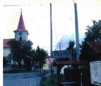
Kostel ve Špičákách.