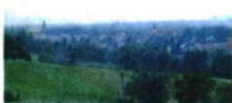
Výhled na Hranice.