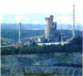
Lom hranické cementárny.

Okrajově mineme přírodní rezervaci nad Kostelíčkem. U velké lípy pak zatočte vlevo. Cesta vede prudce do kopce, po obou stranách minete poslední rodinné domy na území Hranic. Po necelém kilometru dorazíte na nejvyšší místo dnešního výletu. Po levé straně si jistě všimnete stále se rozšiřujícího lomu hranické cementárny.