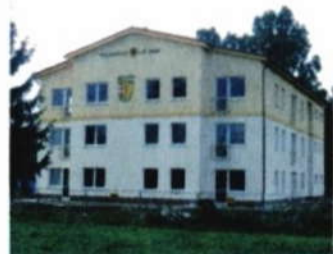
Bytové domy v Bělotině.

V Bělotině projedeme zpět pod železniční trať po hlavní silnici a na konci obce zatočíme vpravo, směr Stráž nad Ludinou. Projedte další část Bělotína, ve které byly letos vystavěny také nové bytové jednotky, železnici tentokrát nadjedete a vydejte se mezi pole nad Bělotinem.