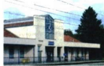
Nádraží v Polomí.

Pod kopcem pěkná cesta po silnici na chvíli končí. Pokud byste jeli dále, mohli byste dojet až na hrad Starý Jičín. Na křižovatce mezinárodní cyklotrasy s cyklotrasou číslo 6225 se vydáme již po stezce místní. Ta nás zavede kolem tří polomských rybníků do Polomí. Po pravé straně vedou koleje, z dálky si můžete prohlédnout nedávno zrekonstruovanou nádražní budovu.