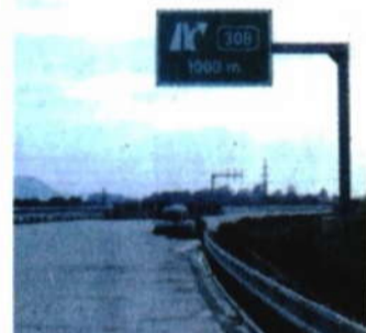
Odbočka na Hranice.

po poli, dostanete se již na úsek dálnice, po kterém se dá na kole jet. Po rovině s větrem v zádech jste u exitu Hranice za chvíli. Stačí jen překonat několik mírných zatáček.