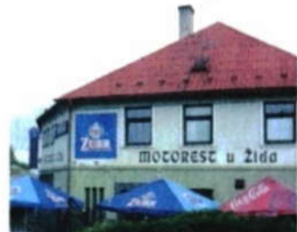
Motorrest v Bělotině

U vlakové zastávky v Bělotině trať podjedete. Dostanete se tak do centra obce.