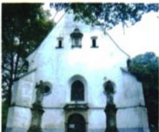
Poutní místo Kostelíček.

Okrajově mineme přírodní rezervaci nad Kostelíčkem. U velké lípy pak zatočte vlevo. Cesta vede prudce do kopce, po obou stranách minete poslední rodinné domy na území Hranic. Po necelém kilometru dorazíte na nejvyšší místo dnešního výletu. Po levé straně si jistě všimnete stále se rozšiřujícího lomu hranické cementárny.