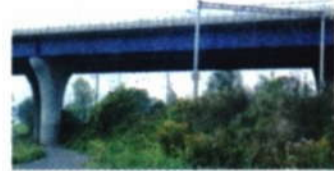
Křížení dálnice v Bělotině

Asfaltová cesta se mezi Polomí a Bělotinem střídá se zpevněnou cestou šterkovou. Před Bělotinem dochází k zajímavému křížení. Zatímco cyklostezka vede souběžně s železničním koridorem rovně, silnice se náhle stáčí a vede kousek nad vámi po bělotínském obchvatu. Cestou jedete kolem dvou rybníků v Bělotině.