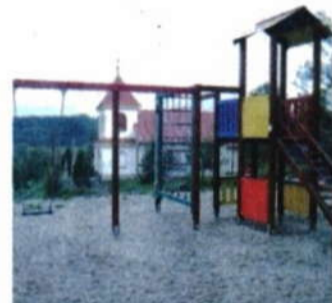
Dětské hřiště v Heřmanicích.

ravskoslezského. V obci Heřmanice, místní části Starého Jičina, se můžete zastavit třeba v areálu místní restaurace. Nedávno zde totiž bylo otevřeno dětské hřiště. Jedou-li s vámi děti, jistě ocení nové průlezkové skružky a houpačky.