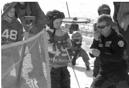
Závody pro nejmenší lyžaře – pro děti od tří do šesti let